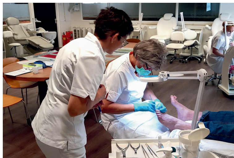
Praktikles Medisch Pedicure locatie Almelo